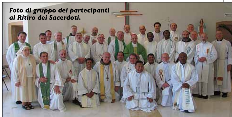
Foto di gruppo dei partecipanti al Ritiro dei Sacerdoti.

Casa di Spiritualità Oasi di Nazareth - Corato 13-16 giugno 2010